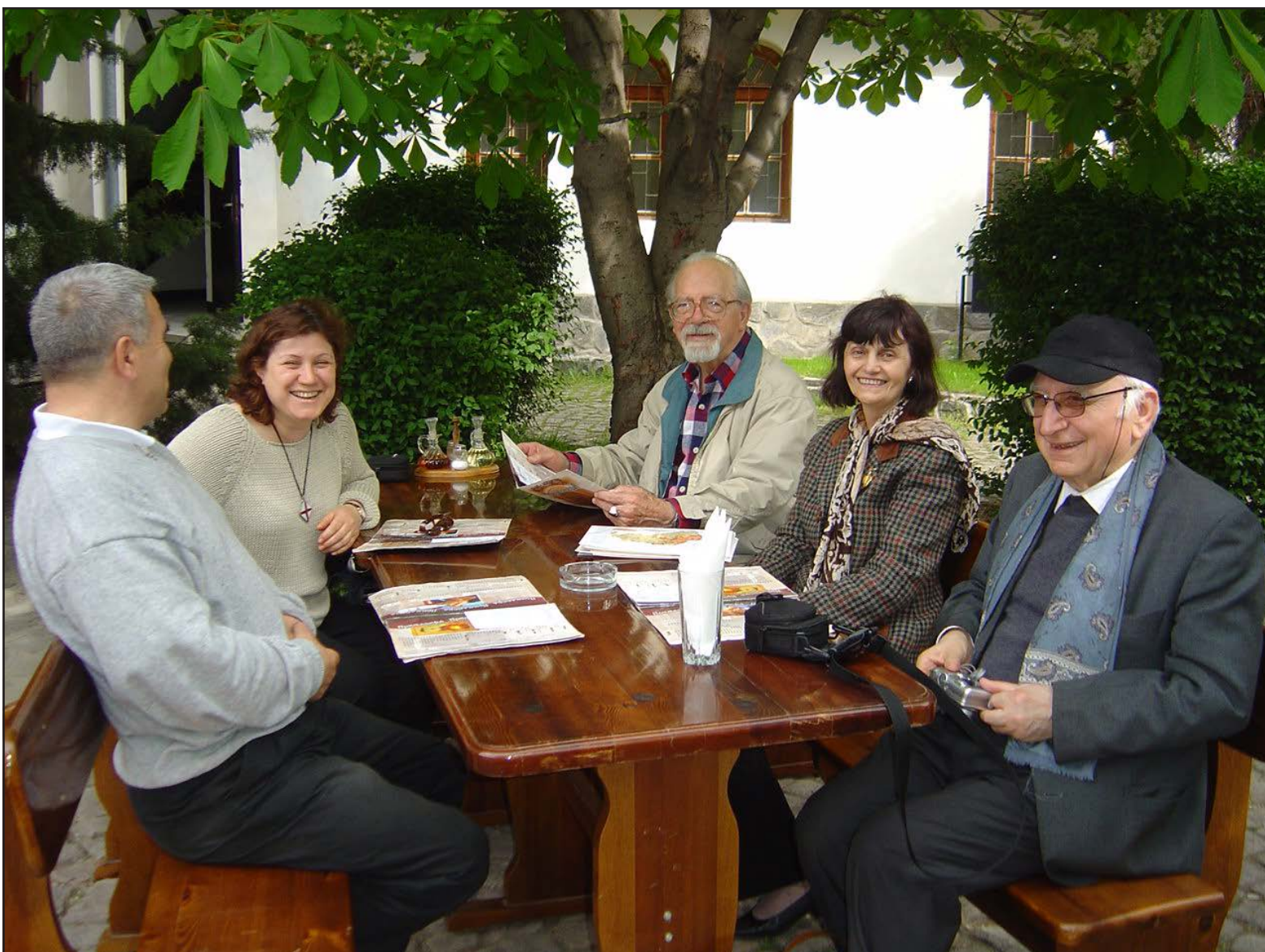
Паметната среща в Пазарджик, 2004 г.